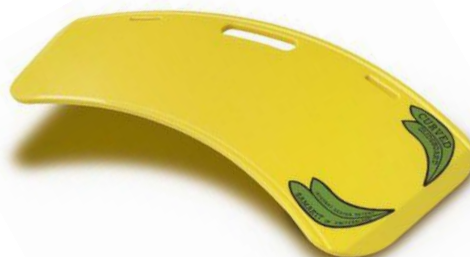
PLANCHE DE TRANSFERT GLIDEBOARD SELFGLIDE

Longueur 50 cm Largeur 21 cm Matière synthétique