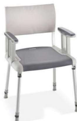
Sans découpe anatomique

Art. 441572 (sans découpe intime) Institutions CHF 189.- TVA excl.