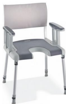
Avec découpe anatomique

Chaise de douche sûre et confortable avec dossier et accoudoirs. Surface antidérapante au toucher doux, montage simple et réglage en hauteur sans outils. Dossier et accoudoirs amovibles. Réglage individuel et flexible grâce au dos doux conception modulaires. Données techniques: hauteur totale 85 à 99 cm. Largeur totale 52 cm. Profondeur totale 43 cm. Largeur d'assise 40 cm. Profondeur d'assise 40 cm. Hauteur d'assise 46 à 61 cm. Largeur du dossier 50 cm. Hauteur dossier 38 cm. Hauteur du coussin de dossier 25 cm. Accoudoir hauteur 19,5 cm. Largeur entre les accoudoirs 45 cm. Capacité de charge 135 kg. Poids 5,5 kg. Couleur blanc-gris.